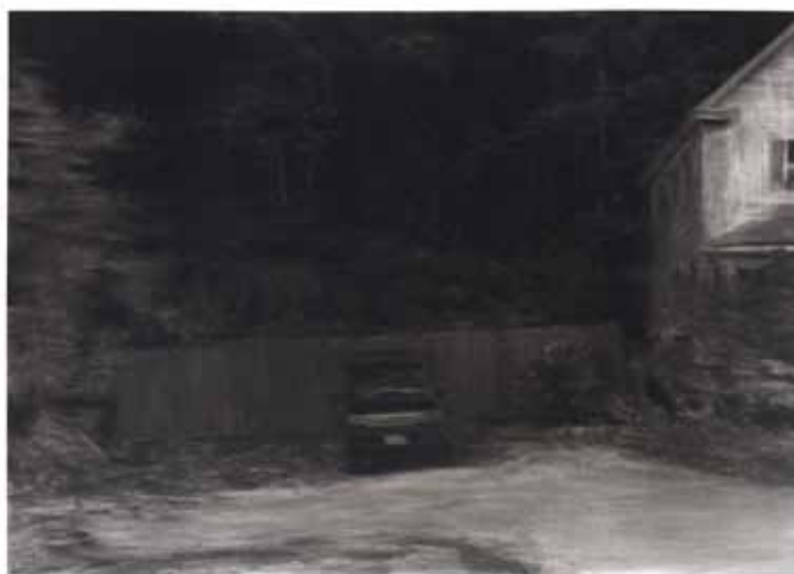
Renie Spoelstra • House with car • 2010