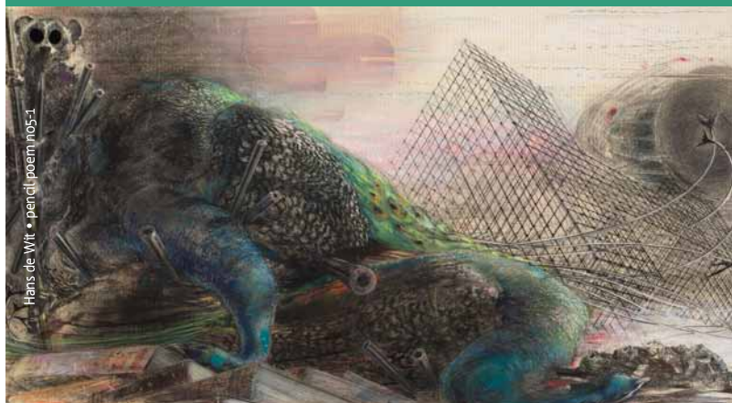
Hans de Wit • pencil/poem n05-1