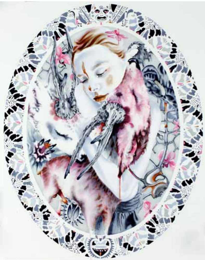
Oval 11-09-10