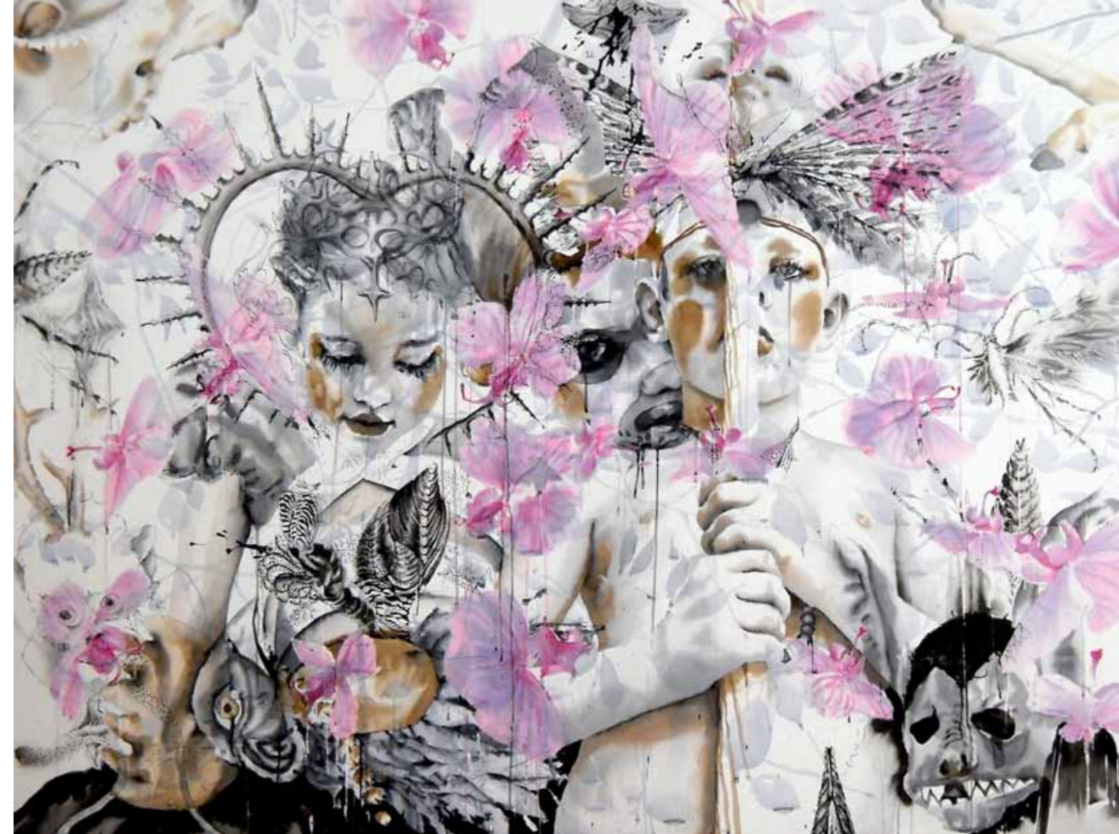
Paradise 11-01-10