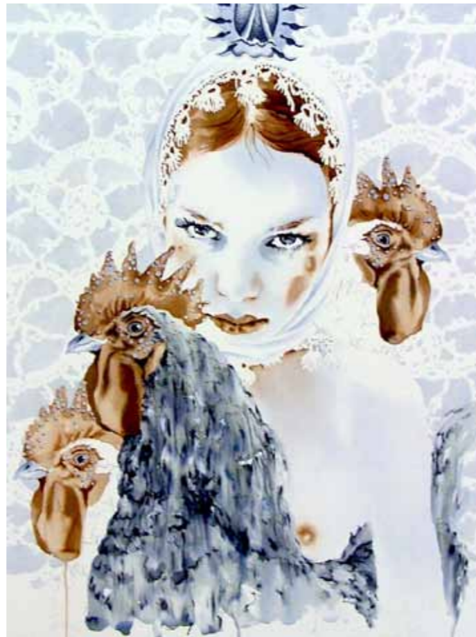
Fallada 01-07-10