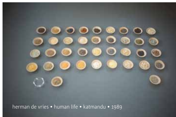
herman de vries • human life • katmandu • 1989

Dinsdag tot en met zondag van 11 tot 17 uur. Toegang gratis. De tuinen van kasteel Twickel zijn gesloten op maandag, en op de zondagen 11 en 25 september. Voor de tuinen van Twickel geldt de normale entreeprijs (€ 5,-). Op vertoon van de routebeschrijving € 1,- korting.