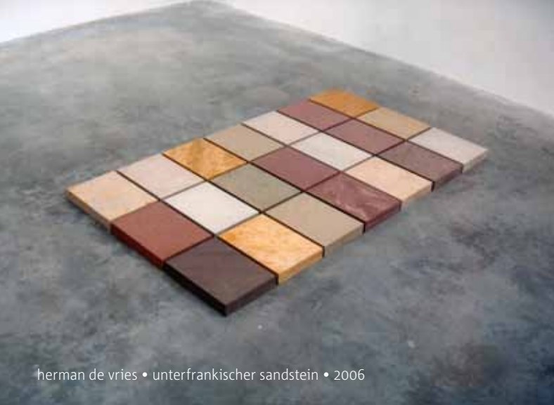
herman de vries • unterfrankischer sandstein • 2006

Kunstvereniging Diepenheim nodigt u van harte uit voor de opening van i am van herman de vries op vrijdag 9 september in de Johanneskerk aan de Grotestraat 1 in Diepenheim. Wij zijn verheugd dat de kunstenaar zijn komst heeft aangekondigd